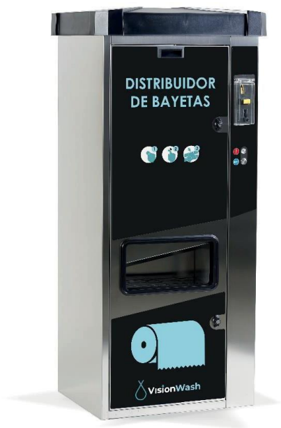
EXPENDEDOR DE PAPEL DP PRO